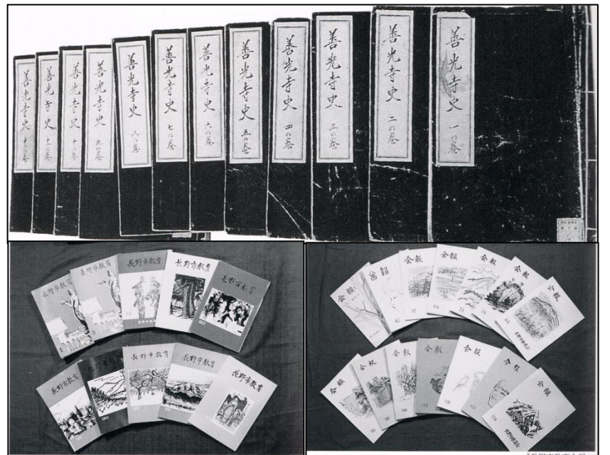
<各種刊行物> 上 坂井 衡平著「善光寺史」 左下 会誌「長野市教育」 右下「長野市教育会報」