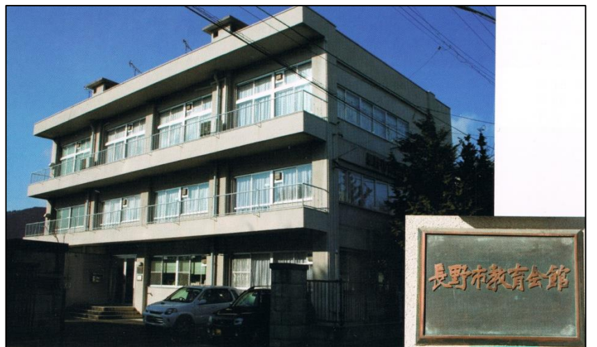
<2010年まで使われていた長野市教育会館>